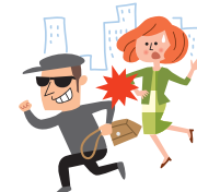
通勤途中でハンドバックを奪われた