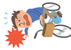
自転車から落ちてケガ

（保険金をお支払いする主な場合、保険金をお支払いしない主な場合についてはこのパンフレットの後記「補償の概要等」をご覧ください。）