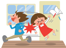
子供が他人にケガをさせてしまった