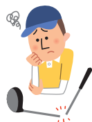
ゴルフ中、自分のクラブを折ってしまった