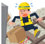
部品を搬送中、足に落としてケガ

例えば、こんな場合に保険金をお支払いします。（国内外問わず対象となります。） 急激かつ偶然な外来の事故