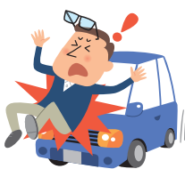
乗物にはねられた時のケガ