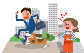
犬の散歩中、他人に噛みつきケガをさせてしまった