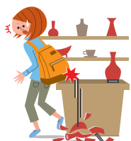
買い物中、商品にぶつかって商品を壊してしまった