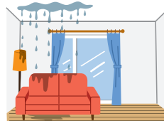
風呂の水を止め忘れ水漏れを起こし階下の人に損害を与えた